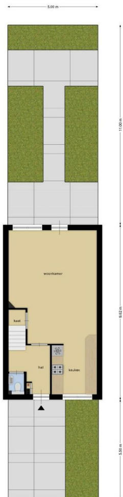
Deze plattegronden zijn opgemaakt voor indicatieve doeleinden. Hieraan kunnen geen rechten worden ontleend.