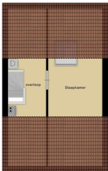
Deze plattegronden zijn opgemaakt voor indicatieve doeleinden. Hieraan kunnen geen rechten worden ontleend.